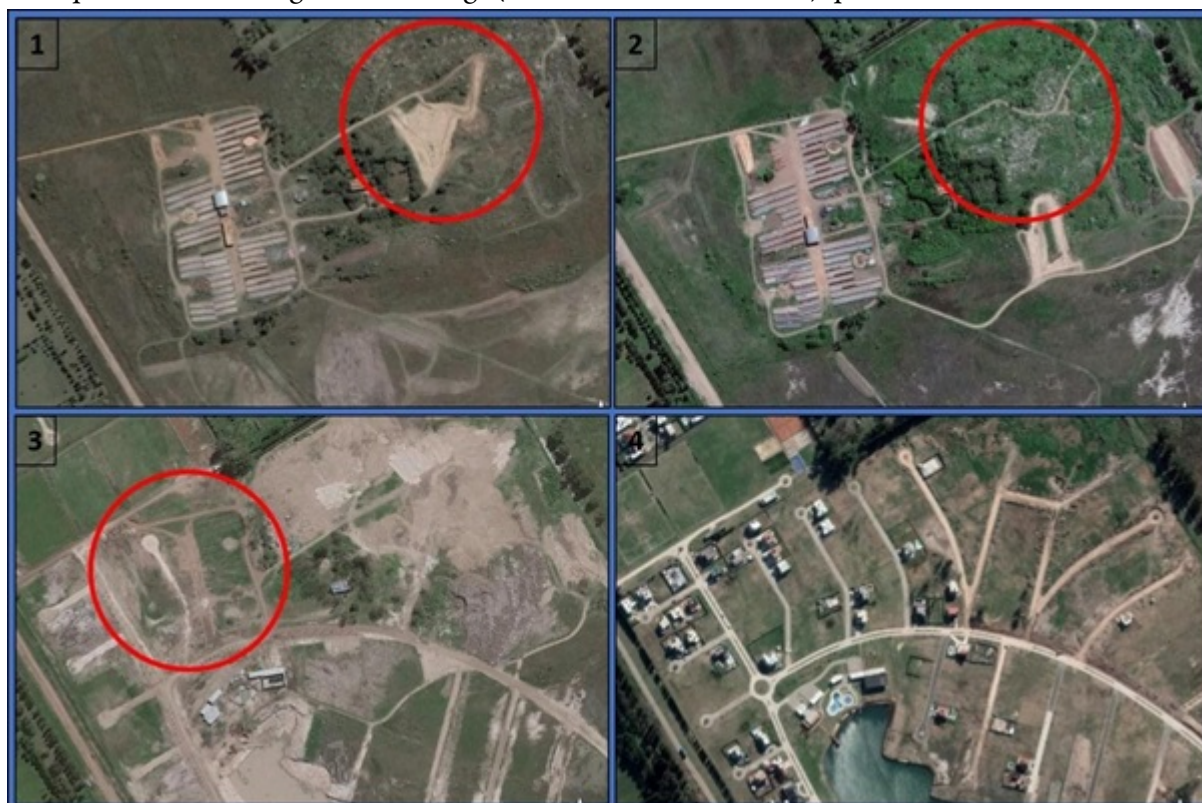
Figura 2. Ciclo económico y reconversión de ladrillera artesanal en urbanización cerrada. Emprendimiento “Lagos de Canning” (34°53’07” S, 58°28’35’ O), partido de Esteban Echeverría

1) Año 2004. Auge: ladrillera en pleno funcionamiento. 2) Año 2010. Inicio de la decadencia: las zonas de extracción se han ido agotando y algunas son ofrecidas para la deposición de residuos (arriba a la derecha de la imagen). 3) Año 2012. Colapso e inicio de la reinversión: la actividad ladrillera ha sido totalmente abandonada y comienza a acondicionarse el predio para su urbanización. 4) Año 2019. Reconversión: para ese año ya se ven avanzados la venta y edificación de lotes, los espacios comunes y una laguna sobre viejas cavas.