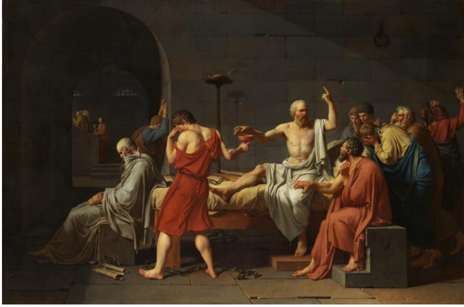
Resim 2. Jacques Louis David, Sokrates'in Ölümü, Tuval üzerine yağlı boya, 130x196 cm, 1787, Metropolitan Museum of Art, New York, ABD. (Farthing, 2010: 262).

Jacques Louis David'in "Sokrates'in Ölümü" isimli yapıtı, Yunan Filozof Sokrates'in Atinalı idarecilere karşı muhalif düşünceleri ve gençlerin ahlakını bozduğu gerekçeleriyle suçlanıp baldıran zehri içerek ölüme mahkûm edilmesini konu almıştır. Özel bir mesen için yapılan eserin kahramanlık teması ve klasik formları Neoklasisizm'in tipik ve önemli özelliklerini barındırmaktadır. Öğrencileri tarafından yapılan ziyaretinde mahkumiyeti sırasında zehri içmeden önceki haliyle sunulan bu anda Sokrates'in enerjik el hareketi ve vücudunun duruşu etrafını saran kederli figürlerle zıtlık oluşturmaktadır. Işık ve gölgeyle vurgulanan figürlerin hareketleri öne çıkartılmış, merkez figür sanki ilahi ışıkla yıkanmıştır (Farthing, 2010: 262). Ancak buradaki ışıklandırma Barok ışıktan izler taşısa da bir filozof olan Sokrates'in ölümünü konu almasıyla bile başlı başına neoklasisist tarzda işlendiğini izleyicisine anlatmaktadır. Düşüncelerinden taviz vermeyerek korkusuzca ölüme meydan okuyan antik felsefecinin kahramanlığı, asaleti, onuru, şerefi okunabilmektedir. Hem tarihlendirme, konu, üslup, hem de anlatım özelliği açısından yerini belli etmektedir.