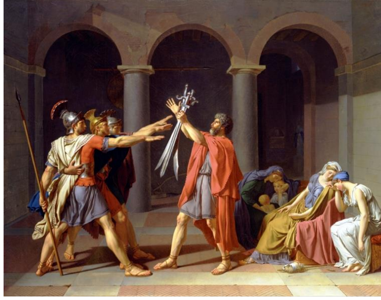
Resim 1. Jacques Louis David Horace Kardeşlerin Yemini, Tuval üzerine yağlı boya, 330x425 cm, 1784, Louvre Müzesi, Paris, Fransa. (Farthing, 2010: 260).

Konusu antik bir hikâyeden alınan Horace'ların Yemini adlı resim Neoklasisizmin ilk baş yapıtı olarak nitelendirilmektedir (Farthing, 2010: 261). Cornaille'nin Horace (Horatius) isimli trajedisinden esinlenerek oluşturduğu Horatiuslar'ın Yemini, Fransa'nın devrim öncesi karışık yapısına çözüm arayışı sunan bir sanat yapıtı olarak kabul görülmüştür (Eczacıbaşı Sanat Ansiklopedisi (a), 1997, 428). Kral tarafından Güzel Sanatlar Bakanlığı için sipariş edilen eser David'in ellerinde özgün bir üslupla ortaya konularak sanat tarihinin mihenk taşlarından birini oluşturmuştur. Neoklasisizmde ön plana çıkan fotoğrafik gerçeklik etkisi eserde fırça tuşelerinin yumuşaklığıyla teknik mükemmelliği ortaya çıkaran unsurlarla donatılmıştır.