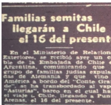
Imagen N°1. Diario La Hora 13 de marzo 1939