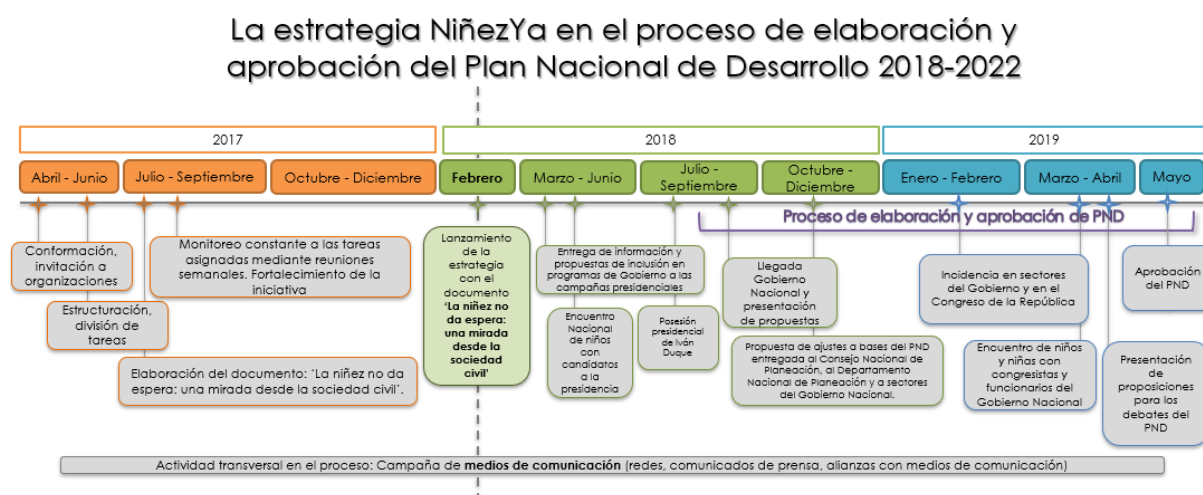
Figura 1. Línea del tiempo NiñezYA