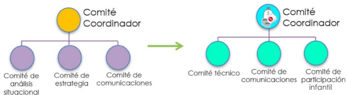
Figura 2. Modificación de la estructura interna de NiñezYa