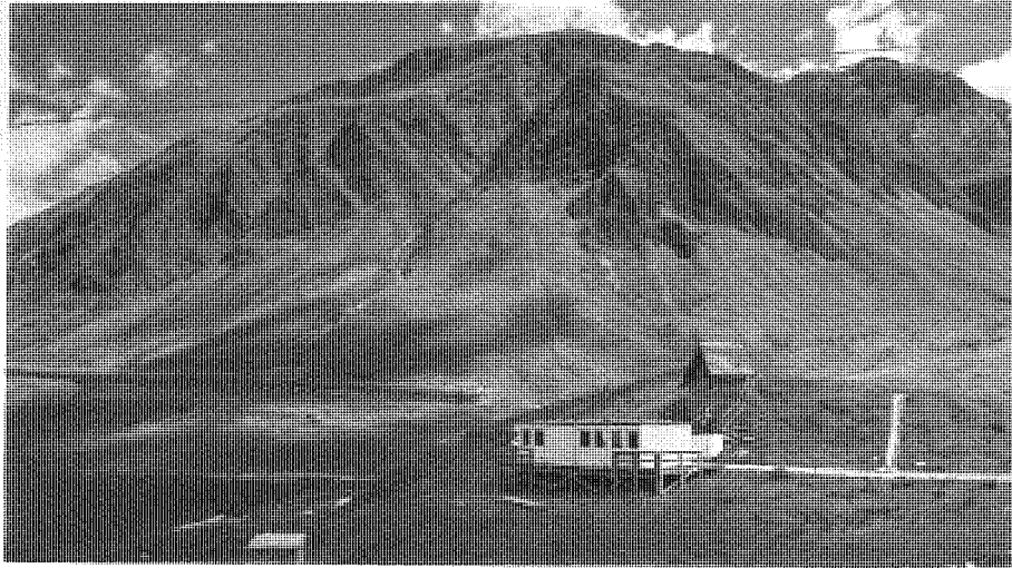
Abb. 3: Militärbunker auf dem Lukmanierpass: «abgelegenste[s] Asylzentrum der Schweiz». Bild: Carlo Reguzzi, Keystone, NZZ, 30. Juni 2015.

Ein Blick in die Vergangenheit soll Aufschluss darüber geben, wie sich die Unterbringung von Geflüchteten in abgelegenen Bunkern und Kasernen in den Gemeinden durchsetzen und zum Common Sense werden konnte. Im Ersten Weltkrieg urteilte das Intelligenzblatt der Stadt Bern : «Es wäre kühn, die Flüchtlinge und Flüchtigen als einen Ersatz für das ausgebliebene Reisepublikum und Wintergastvolk einzuschätzen.» 50 Das Blatt war der Meinung, dass sich die Schweiz mit ihrer darniederliegenden Hotellerie «besonders zur Masseninternierung» eigne. 51 Die Quelle offenbart, dass Räume zur Beherbergung von Geflüchteten gesellschaftlich noch nicht definiert waren; infrage kamen Gastfamilien, Hotels, Pensionen, Sanatorien etc. Jedoch wurde bereits damals bei einigen Kriegsgefangenen auf die Infrastruktur der Armee zurückgegriffen: sogenannte renitente Internierte wurden in Militärkasernen untergebracht. 52