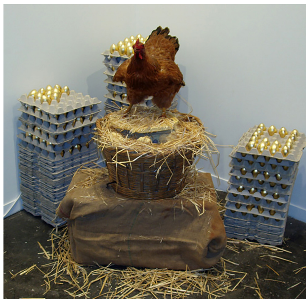
4. Pilar Albarracín, La ponedora (2006). Cortesía de la artista < http://www.pilaralbarracin.com/instalaciones/instalaciones16.html >