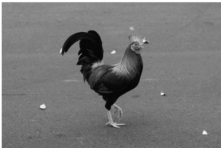
2. Gallo doméstico en un parque urbano de la provincia de Málaga.

indivisibles las anteriores disciplinas porque ni la historia ni la evolución biológica fueron exclusivamente humanas. Si bien la gallina es uno más de esos casos de relaciones complejas que hemos mantenido con otras especies, que con frecuen-