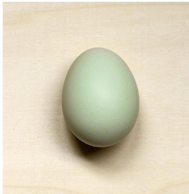
1. Huevo de gallina Araucana. Característico por los tonos verdeazulados de su cáscara.

Atender al viaje interespecie entre humanos y gallinas, es atender a una historia intrincada y compleja que obligatoriamente nos acerca al concepto naturocultura. Este término recalca la complejidad de la convivencia entre especies donde todo contexto es una mezcla compleja de estratos de historia y de biología (Braidotti y Hlavajova, 2018: 269). En la generación de un nuevo relato, de la construcción de una nueva narración que explique nuestro pasado, resultan