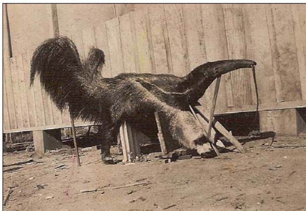
FIGURA 1. Tamanduá-bandeira ( Myrmecophaga tridactyla ), abatido no município de Paranavaí no ano de 1950.

A confirmação da ocorrência da espécie através de exemplares de museu ocorreu apenas em