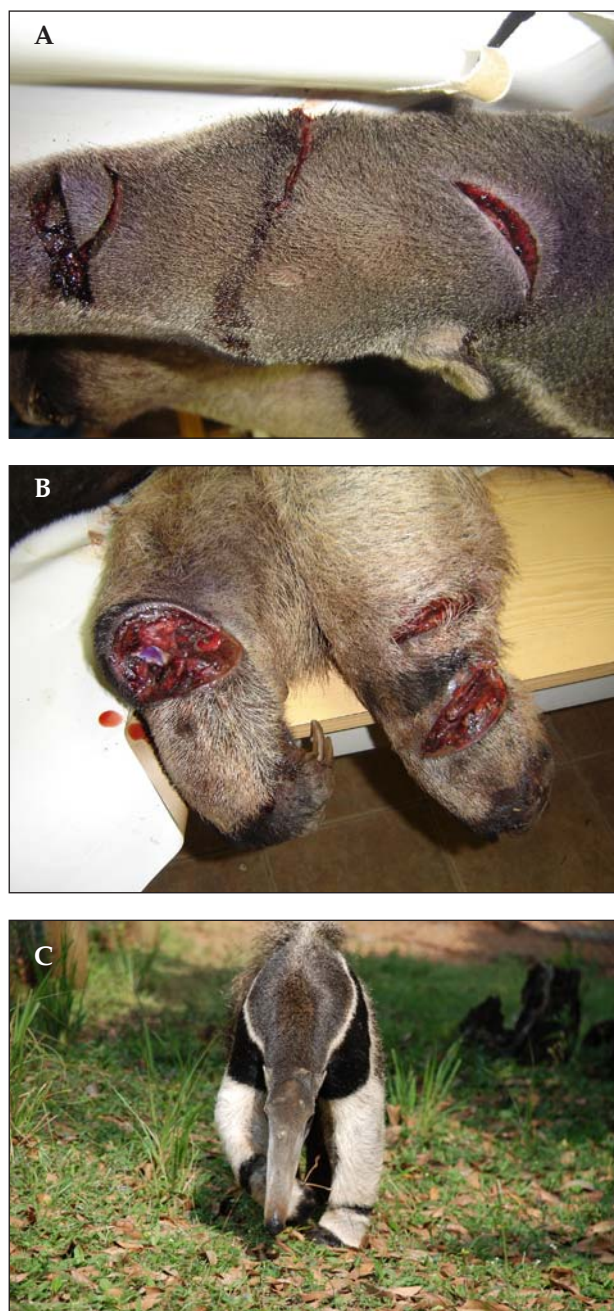
FIGURA 4. Indivíduo macho de tamanduá-bandeira ( Myrmecophaga tridactyla ), resgatado no bairro Cavernas, município de Pirai do Sul, em novembro de 2005: (A) e (B) detalhes dos ferimentos, (C) após a sua recuperação, em cativeiro.

de ocorrer pela dificuldade de localização dos indivíduos remanescentes. Em fevereiro de 2002 um indivíduo foi observado transitando entre os capões (ilhas florestais com Araucária em meio às áreas de Campos) da fazenda Monte Negro. Em propriedade vizinha (fazenda 4N) foram feitos registros visuais e fotográficos de pelo menos três indivíduos distintos (Fernanda G. Braga, obs. pess.) (FIG. 3). Ainda em Pirai do Sul, no bairro Cavernas, um indivíduo, macho, foi encontrado no dia 15 de novembro de 2005 com ferimentos (FIG. 4) feitos por caçadores que invadiram uma propriedade rural (Vlamiir J. Rocha, com.