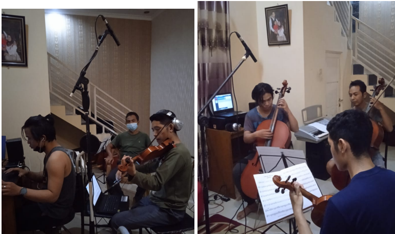
Gambar 3 & 4. Situasi proses perekaman audio

Perekaman audio dan video dilaksanakan pada bulan Juni hingga Juli 2021 di EL Musik studio. Proses perekaman menggunakan dua