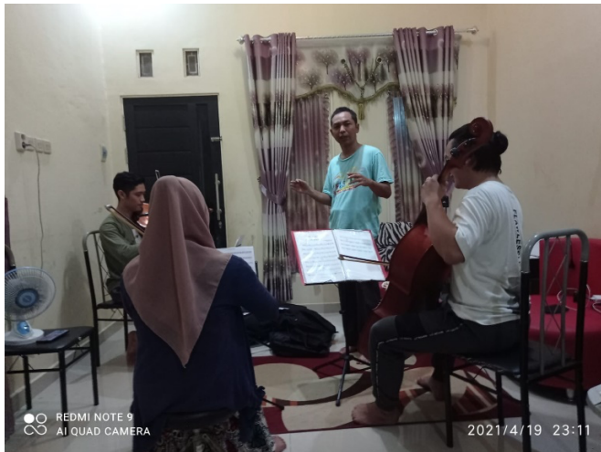
Gambar 2. Suasana Latihan

Tahap pertama yang dilatih dalam proses latihan adalah penguasaan nada, tempo, bentuk musik, teknik gesek, artikulasi, ekspresi, gaya musik pada setiap lagu yang telah diaransemen. Tahap kedua adalah memainkan setiap karya lagu yang telah diaransemen dengan lancar tanpa terhenti, dan dimainkan dengan ekspresi yang sesuai pada karakter karya lagu.