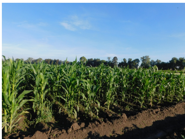
Figura 2. Lote de producción de semilla básica de la variedad sintética de maíz CP-Tania 5. Montecillo, Edo. Méx. 2019.

La variedad sintética de maíz CP-Tania 5 es de alto rendimiento ( 8.6 \text{ t ha}^{-1} ), posee resistencia genética