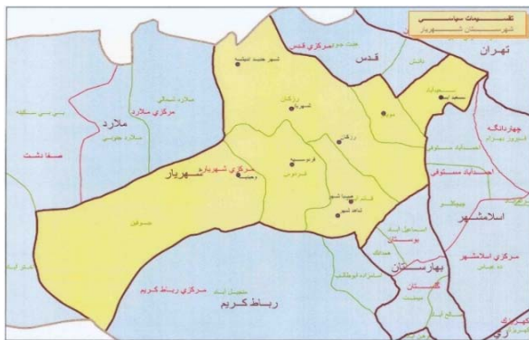
شکل ۳) نقشه تقسیمات سیاسی شهرستان شهریار (Ministry of Interior, 2016)

بنابراین، راهبردهای پهنه برای این شهرستان در قالب راهبردهای تدافعی قابل طراحی است.