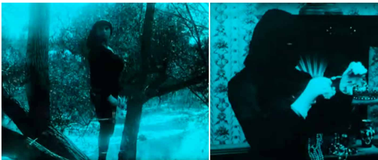
Fig. 4. La Garza justo antes de tapar su cara, para el robo de la joya de la condesa (izda.) y la Garza encapuchada robando la joya (dcha.). Alberto Marro. La secta de los misteriosos . Fotograma de la película. Barcelona. 1916.

Con relación a la segunda categoría propuesta, es decir, el corte del plano, en este film se pueden analizar dos ejemplos de la omisión de la violencia sobre los cuerpos femeninos mediante el montaje del metraje. En primer lugar, en el rapto de Alexia, los planos se cortan de manera intencional para omitir los golpes que la Garza le propina para dejarla inconsciente y proceder a