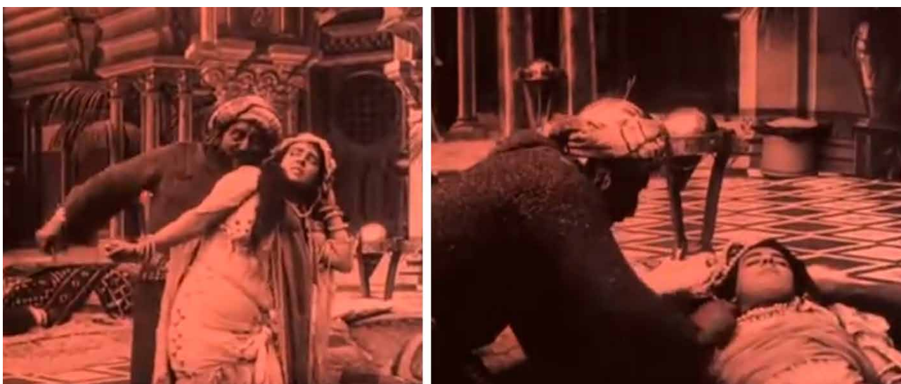
Fig. 7. Omisión de la violencia por montaje: el agresor saca el cuchillo mientras agarra a Fátima (izda.), Fátima ya está muerta y yace tumbada (dcha.). Alberto Marro. La secta de los misteriosos. Fotograma de la película. Barcelona. 1916.

Por último, es reseñable respecto al montaje que, si bien el plano general abunda en el metraje, se realizan varios cortes que mantie-