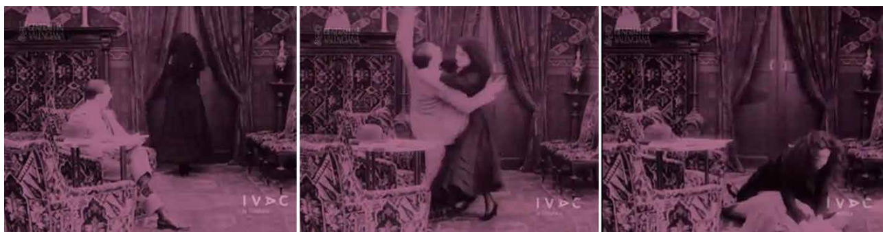
Fig. 9. Secuencia final de la venganza de Margarita en donde cierra la puerta (izda.), ataca a Luis (centro) y le da muerte (dcha.), sin cortes ni omisiones, todo ello en PG. Magín Murià. El beso de la muerte . Fotograma de la película. España. 1917.

fílmica, solo permite acercamientos de planos generales a planos medios en puntos de giro conclusivos o en presentaciones de objetos de interés. Cabe resaltar la alta prevalencia de jump cuts con el único fin de omitir la violencia sobre los cuerpos en campo.