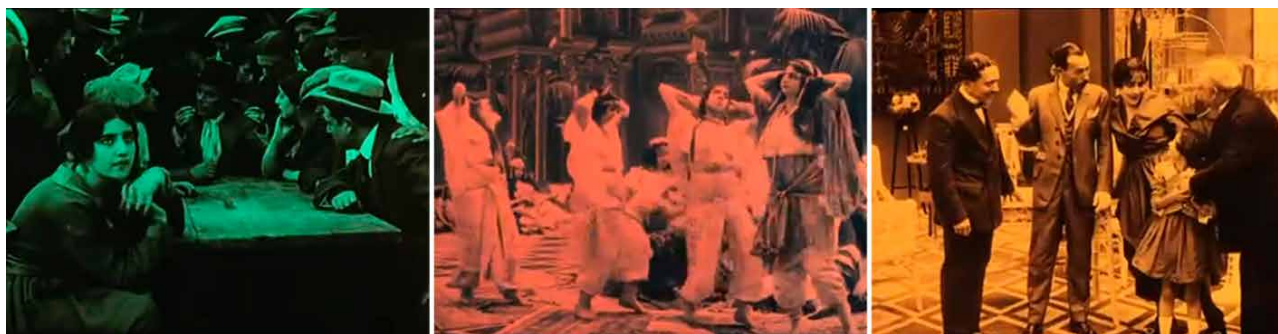
Fig. 3. Diferentes planos generales fijos de corte teatral en donde los personajes entran y salen en campo en: Alberto Marro. La secta de los misteriosos . Fotogramas de la película. Barcelona. 1916.

del Friuli y llevó a su actual restauración por parte de la Filmoteca de Catalunya.