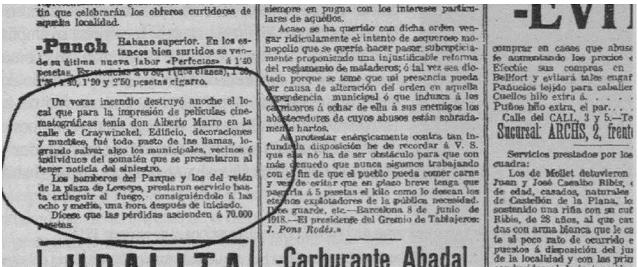
Fig. 2. Noticia del incendio en la Hispano Films, publicada el 09/06/1918 en La Vanguardia , obtenida a través de CARDONAARNAU, Rosa. "La recuperación de la versión para el mercado alemán de la secta de los misteriosos (Alberto Marro, 1917)". Op. cit. , pág. 67.