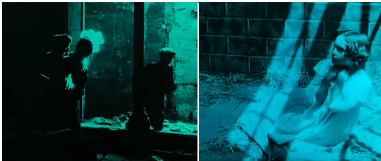
Fig. 5. Omisión por código lumínico de la cara la Garza en la huida final (izda.) y el mismo efecto sobre la cara de la niña durante su secuestro (dcha.). Alberto Marro. La secta de los misteriosos . Fotograma de la película. Barcelona. 1916.