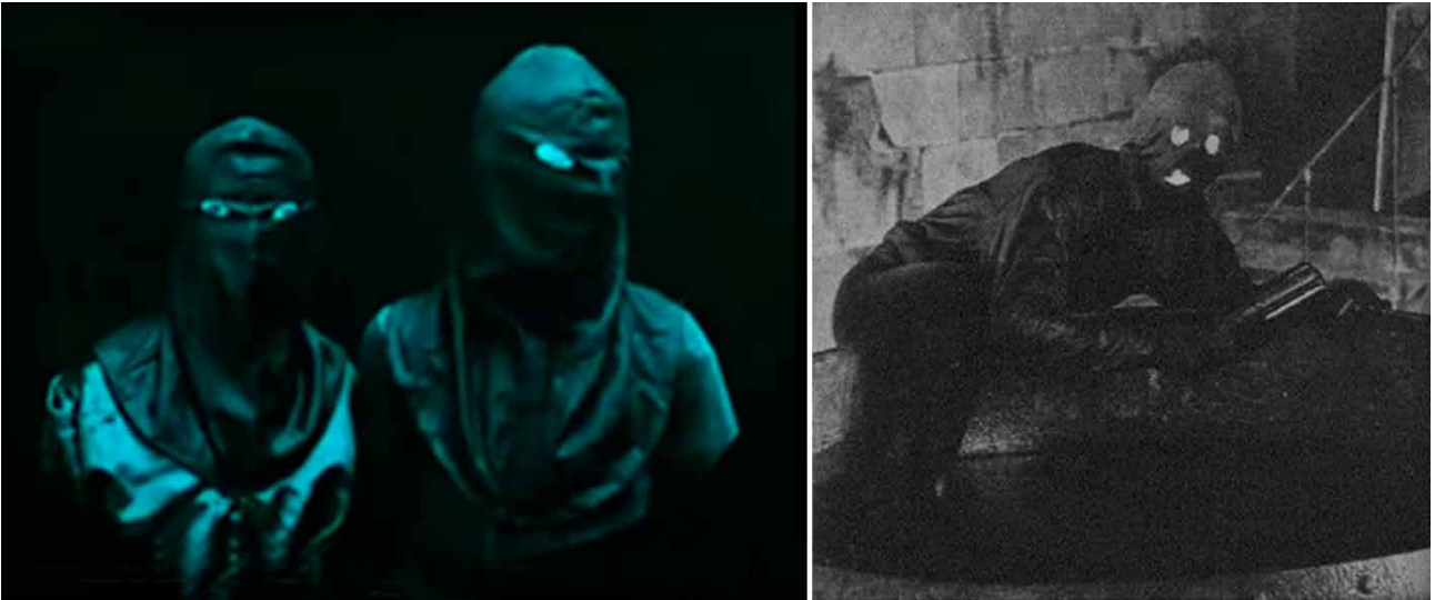
Fig. 1. Comparativa estética de los criminales en: Alberto Marro. La secta de los misteriosos . Fotograma de la película. Barcelona. 1916 y Louis Feuillade. Fantômas . Fotograma de la película. Francia. 1914.

documental producido por la propia Filmoteca La Secta de los misteriosos 24 , explicando el complejo proceso de restauración.