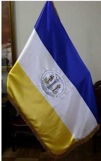
Ilustración 3. Bandera Patria Vieja.