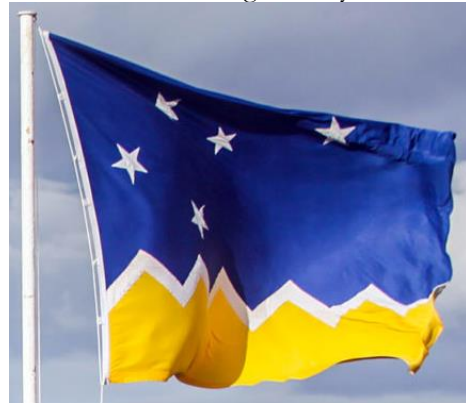
Ilustración 4. Bandera de Magallanes y Antártica Chilena.