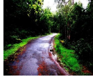
படம்- 2 சுவந்த தோன்றிக் பூக்கள்

பேரிஜாம்’ என்ற பெயரில் ‘தாமான்’ என்ற பெயரை அடையாளம் காணத் துணை செய்வது; தென்கன்னட மாவட்டத்தில் பண்டு வானவாறு என்ற பெயரில் கடலோடு கலந்து தற்போது ஹோனவார் என மருவி வழங்கும் (சேரவாற்றின் திரிந்த வடிவமாகிய) ஷீராவதியின் போக்கில் வந்து வீழும் ஜோக் அருவி (Jog falls). துளு நாட்டில் அமைந்துள்ள இவ்வருவிப்பகுதி சங்க இலக்கியத்தில்; தோகைக்காவின் துளுநாடன்ன (அகநானூறு- 15) என்று குறிக்கப்படுகிறது.