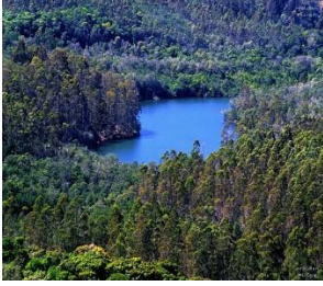
படம்- 1 பேரிஜாம் லேக்