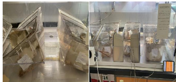
شکل ۱. موش های صحرایی تحت تأثیر دو نوع استرس روانی شامل شیب دار نمودن قفس و پخش صدا

حیوانات مضطرب ترجیح می داند بیش تر در بازوهای بسته بمانند و زمان کمتری را به جست و جو در بازوهای باز بپردازند [۲۲].