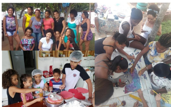
Figura 2: Ações na ONG Raízes do Norte Goiano