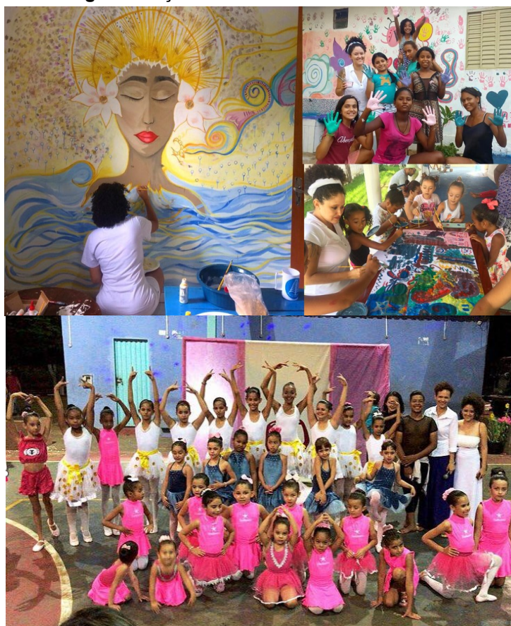
Figura 1: Ações na ONG Raízes do Norte Goiano